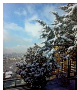
شکل ۱- بام سبز ساخته شده در یکی از مناطق شمال تهران