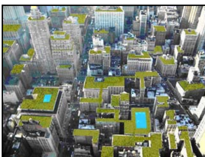
شکل ۲- سامانه بام سبز موضوعی است که در ایران ناشناخته مانده است که در صورت گسترش، مزایای بسیاری با خود همراه خواهد داشت.

امروزه متناسب نمودن کمیت و کیفیت معماری به نخستین دغدغه معماران تبدیل شده است و در رویکرد زیست محیطی با عنوان‌هایی مانند «معماری پایدار» ۱ و «معماری سبز» ۲ بررسی می‌شود. درحالی که پیش از این تنها مؤسسات آموزشی و آژانس‌های دولتی بر ساخت ساختمان‌هایی مطابق با اولویت‌های زیست‌محیطی تأکید داشتند؛ هم‌اکنون مشاغل خصوصی هم هوادار ساخت چنین ساختمان‌هایی شده‌اند. در کشور کانادا و در سال ۲۰۰۰ تعداد ۴۵ ساختمان با مجموع زیربنای ۳ میلیون متر مربع به عضویت نظام راهبری انرژی و طراحی محیط ۳ که توسط شورای ساخت سبز ۴ راه‌اندازی شده بود درآمدند. این تعداد در حال حاضر به ۱۷۱ ساختمان تجاری رسیده است و ۱۸۰۰ ساختمان دیگر نیز برای این امر درخواست جواز نموده‌اند. حدود ۳۰۰۰ مهندس کانادایی دارای مجوز نظام راهبری انرژی و طراحی محیط هستند (Kanter, 2005, 47). در این تحقیق به ارائه معیارهای توسعه سامانه بام سبز در ایران خواهیم پرداخت. نگارندگان بر این موضوع تأکید دارند که در کشور ما بام سبز قبلاً ساخته شده است (شکل ۱) اما سامانه بام سبز موضوع کاملاً متفاوتی است که علی‌رغم توجه بسیاری از کشورهای توسعه یافته و حتی در حال توسعه به آن در کشور ما نه تنها غریب و ناآشنا می‌نماید بلکه تحقیقی در راستای توجیه پذیر نمودن آن صورت نگرفته است. (شکل ۲)